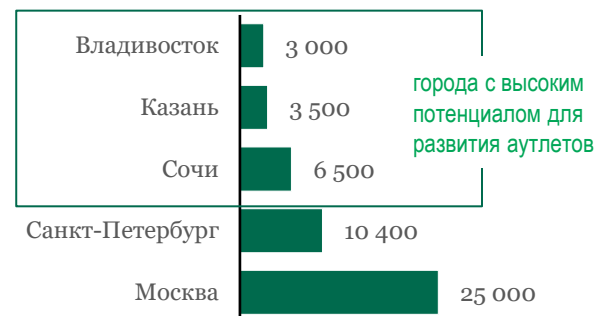
График 3: Туристический поток, количество человек, 2019 г.

Сегодня для развития сегмента аутлетов могут быть интересны города с высокой покупательной способностью и присутствием большого числа брендов, а также туристические кластеры в Сочи (Красная Поляна), на Дальнем Востоке (Владивосток), Казань. В Москве же более перспективным можно назвать строительство дисконт-центров, так как обеспеченность аутлетами находится на уровне европейских городов.